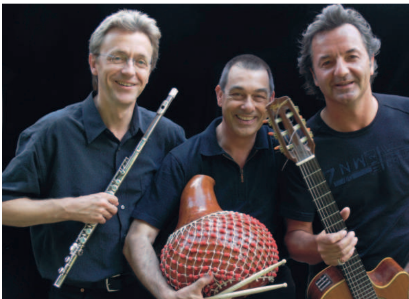
Trio Coppo