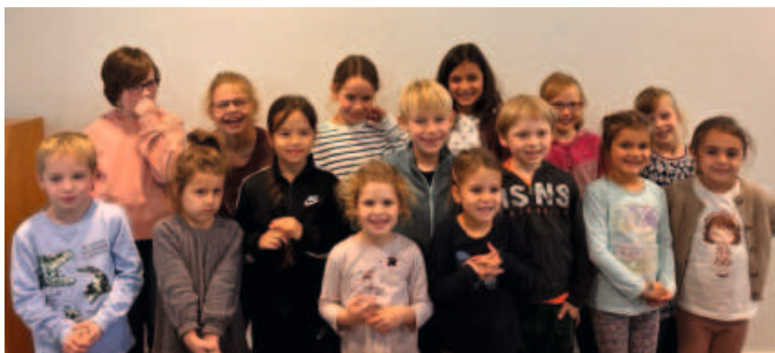
Die Krippenspielkinder 2024! Im Heiligabendgottesdienst um 15 Uhr ist das Krippenspiel zu sehen.

In der Adventszeit könnt ihr während der Gottesdienste eure Lieblingslieder wählen! Am 2. Weihnachtstag singen wir dann die ausgewählten Lieder gemeinsam im Gottesdienst um 11 Uhr in der Friedenskirche. Lasst eure Stimmen hören - bei der Liedwahl und im Gottesdienst! Wir freuen uns auf euch!