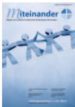
Das erste miteinander

Du übernahmst hierbei die wichtige Schnittstellenkommunikation. Auf Dauer führte die externe Bearbeitung leider nicht zu der vom Redaktionsteam gewünschten Layoutqualität.