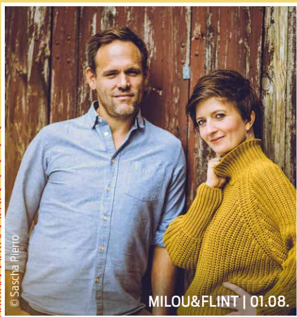
MILOU&FLINT | 01.08.