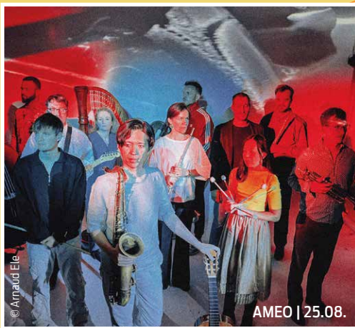
AMEO | 25.08.