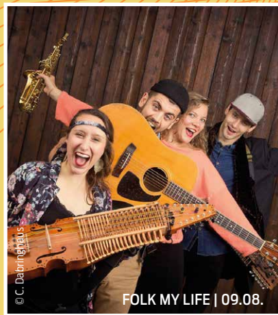
FOLK MY LIFE | 09.08.